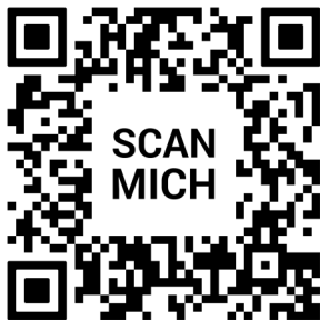
QR Code Pfarr-Homepage