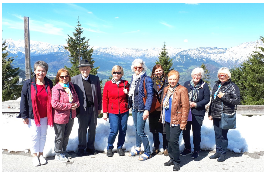
Wallfahrerinnen mit geistlicher Begleitung auf der Strecke von Bayern nach Österreich....